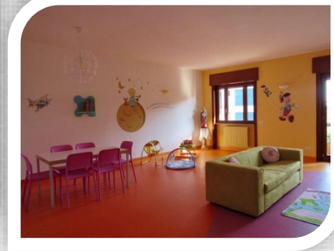
Immagini della sede di Bacoli (Na)