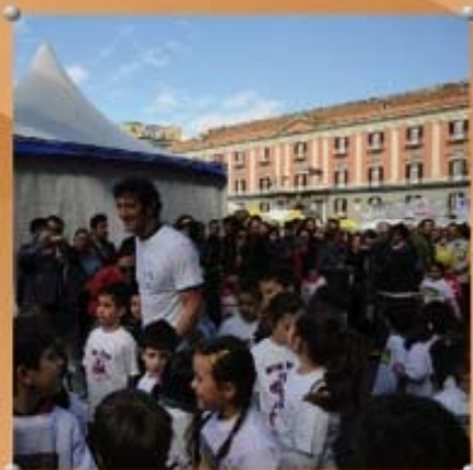
Kids run con Ciro Ferrara