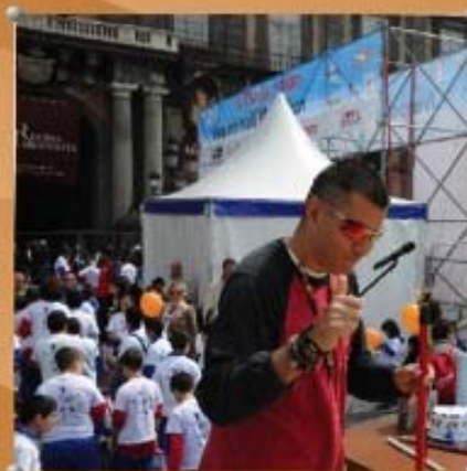
Spettacolo Capone & BungtBangt