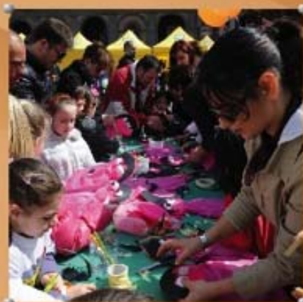
Laboratori di riciclo