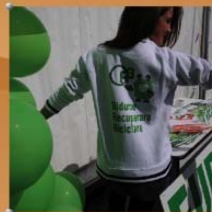
Laboratori di riciclo