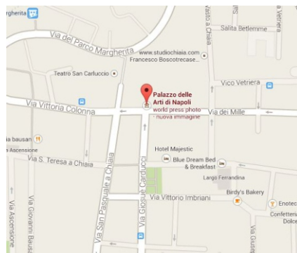
Palazzo delle Arti di Napoli Via dei Mille, 60 80121 Napoli